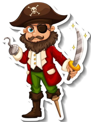
Capitão Gancho 3