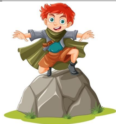
Peter Pan 2